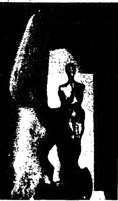
من النحت العراقي المعاصر بيوتز